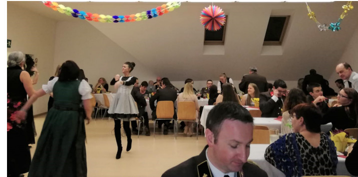
Gute Stimmung am FF Ball

Nebenstehend ein paar ausgewählte Eindrücke aus den diversen Veranstaltungen wie FF Ball, Maibaumaufstellen, Fröhschoppen, Oktoberfest und Adventpunsch.