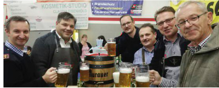
Beim Oktoberfest wurde auf das knusprige Spanferkel angestoßen