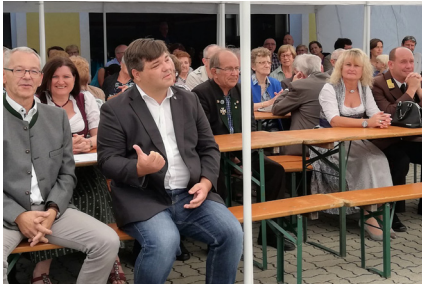
Frühschoppen mit Angelobung und Beförderungen