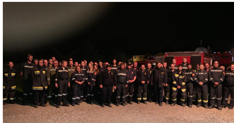
Teilnehmer UA Atemschutzübung Bruderndorf

Intern führen wir ebenfalls verschiedene Schulungen und Übungen durch. Dies reicht vom regelmäßigen Wiederholen des Beladeplans der Fahrzeuge über technische Übungen bis hin zu Löschübungen.