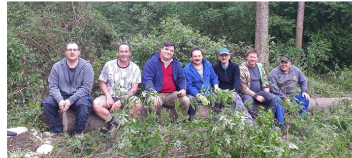
Maibaum erfolgreich umgesägt