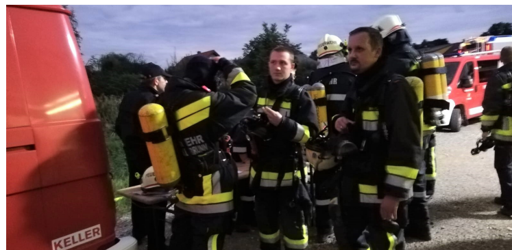
UA Atemschutzübung Bruderndorf