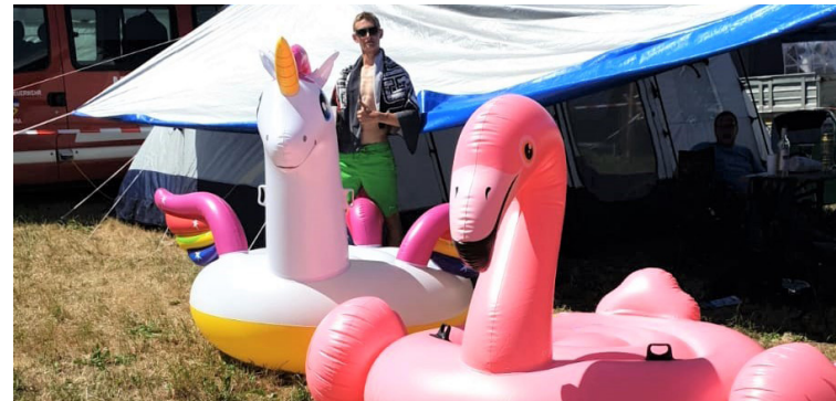
nach dem Wettkampf ist im Zeltlager nicht die Luft draussen